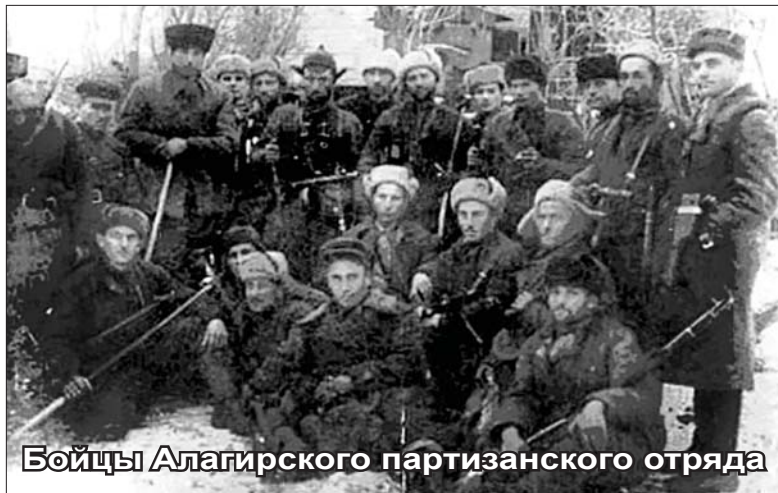
Бойцы Алагирского партизанского отряда