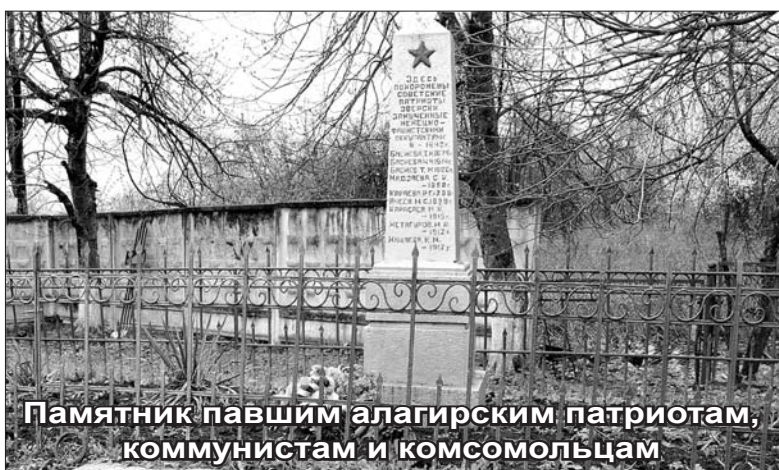
Памятник павшим алагирским патриотам, коммунистам и комсомольцам

Единый контакт-центр СФР: 8-800-100-00-01 (звонок бесплатный).